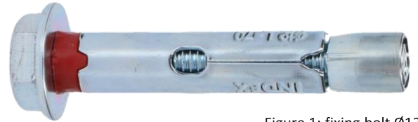
Figure 1: fixing bolt \varnothing 12

If you want to store valuables smaller than 15 mm in the safe, we recommend to store them in a box or other packaging with a large size for extra safety. This prevents burglars from stealing small valuables, for example by means of a vacuum cleaner, when they drill a hole in the safe.