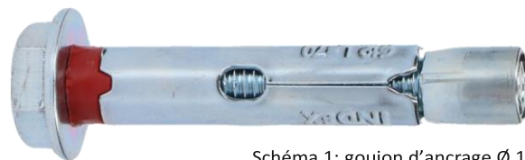
Schéma 1: goujon d'ancrage Ø 12

Si vous souhaitez ranger des objets de valeurs avec une dimension inférieure à 15 mm dans votre coffre-fort, il sera à conseiller de les conserver dans un emballage plus grand, pour avoir plus de sécurité. Ainsi vous éviterez qu'un cambrioleur perce un trou dans le paroi de votre coffre-fort pour voler vos biens avec par exemple un aspirateur.