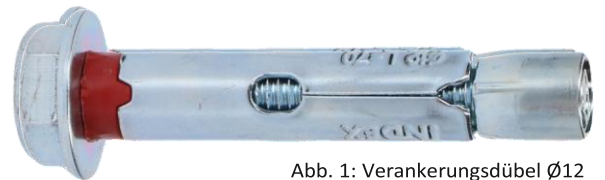
Abb. 1: Verankerungsdübel \varnothing 12

Wenn Sie Wertsachen kleiner als 15 mm im Tresor aufbewahren möchten, empfehlen wir Ihnen, diese aus Sicherheitsgründen in einer größeren Verpackung aufzubewahren. So wird verhindert, dass Einbrecher kleine Wertsachen aus dem Tresor z.B. mit Hilfe eines Staubsaugers stehlen, wenn sie ein Loch bohren.